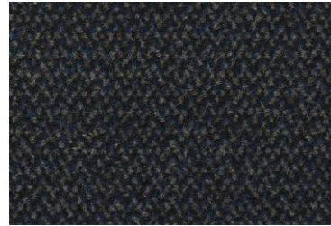
Azul cobalto (BU)