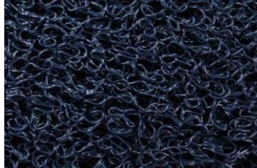
Azul marino (NB)