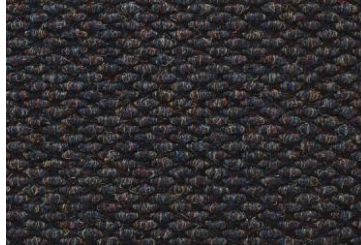
Negro Otoñal (AB)