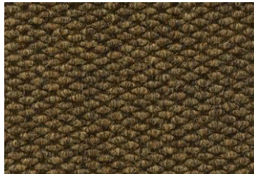
Ocre Otoñal (AO)*