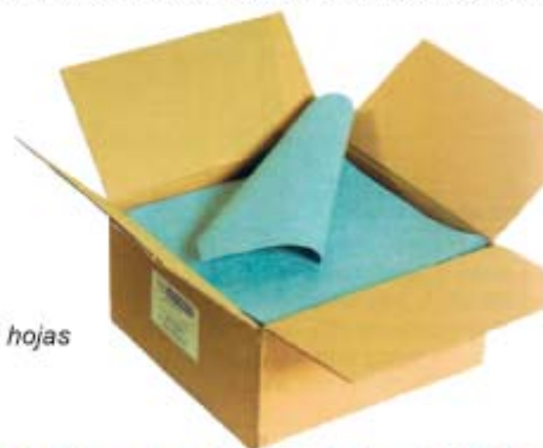
wip 280 250 hojas