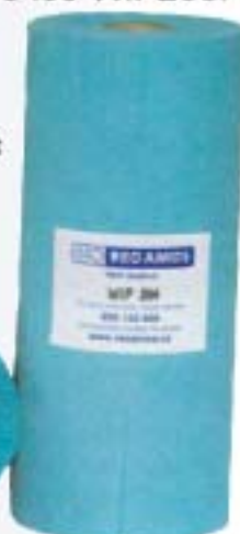
WIP 284 200 hojas