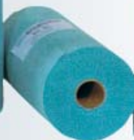
WIP 281 100 hojas