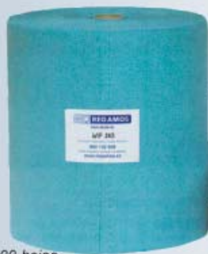
WIP 283 500 hojas

Bayetas de absorción rápida, del mismo tipo que los WIP280 pero más flexibles, ideales para una buena limpieza. Menos capacidad de absorción que los WIP280.